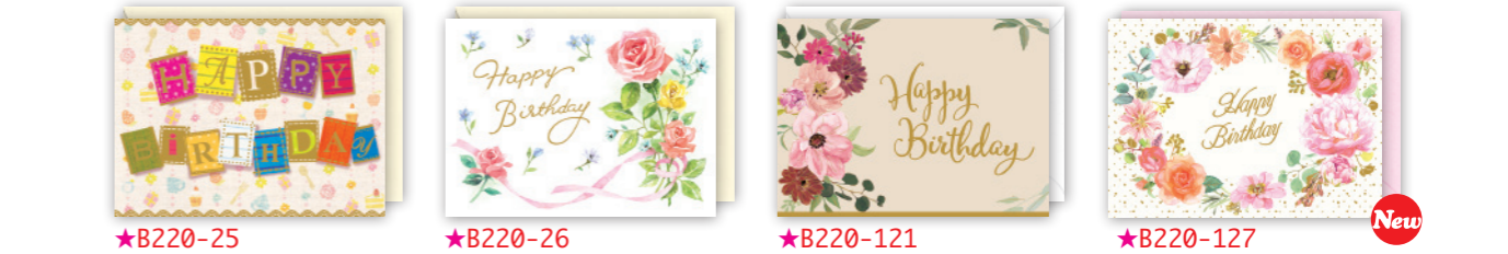
★B220-25 ★B220-26 ★B220-121 ★B220-127 New