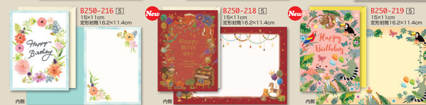
B250-216 [5] 15×11cm 定形封筒16.2×11.4cm B250-218 [5] 15×11cm 定形封筒16.2×11.4cm B250-219 [5] 15×11cm 定形封筒16.2×11.4cm