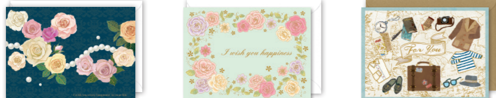
★G300-28 [5] ¥300+税 ★G300-30 [5] ¥300+税 ★G300-31 [5] ¥300+税