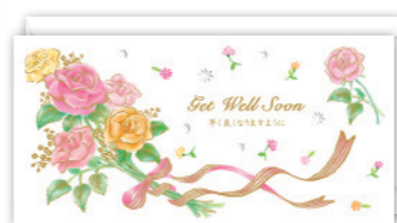
★G300-607 [5] ¥300+税 9×18cm 定形封筒9.8×19cm 聖句 民数6:24