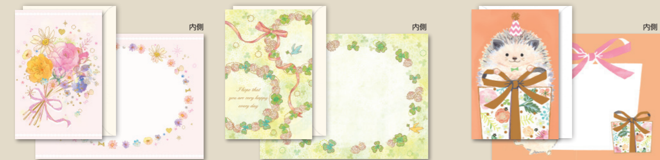
G250-306 [5] 13.5×9cm 定形封筒14.8×9.8cm G250-307 [5] 13.5×9cm 定形封筒14.8×9.8cm G250-308 [5] 13.5×9cm 定形封筒14.8×9.8cm G250-310 [5] 15×11cm 定形封筒16.2×11.4cm