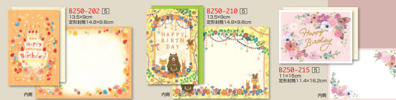
B250-202 [5] 13.5×9cm 定形封筒14.8×9.8cm B250-210 [5] 13.5×9cm 定形封筒14.8×9.8cm B250-215 [5] 11×15cm 定形封筒11.4×16.2cm