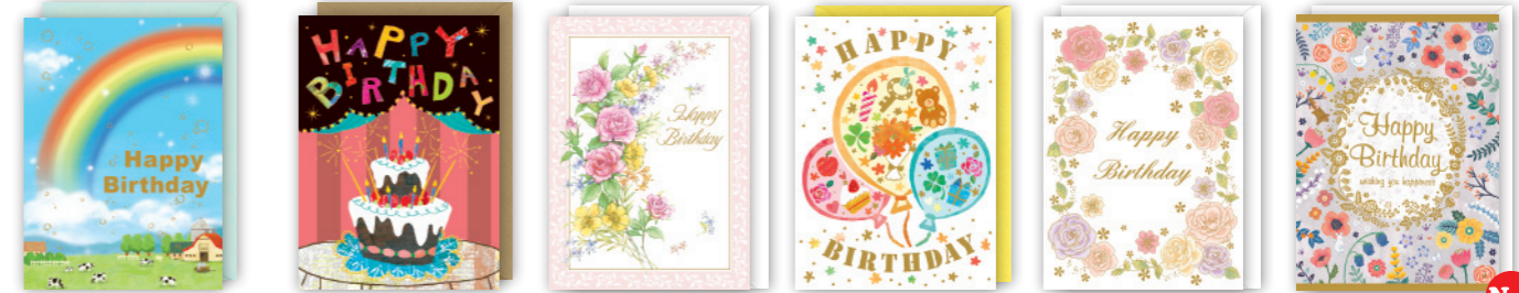
★B300-01 ★B300-04 ★B300-20 ★B300-23 ★B300-24 ★B220-126 New