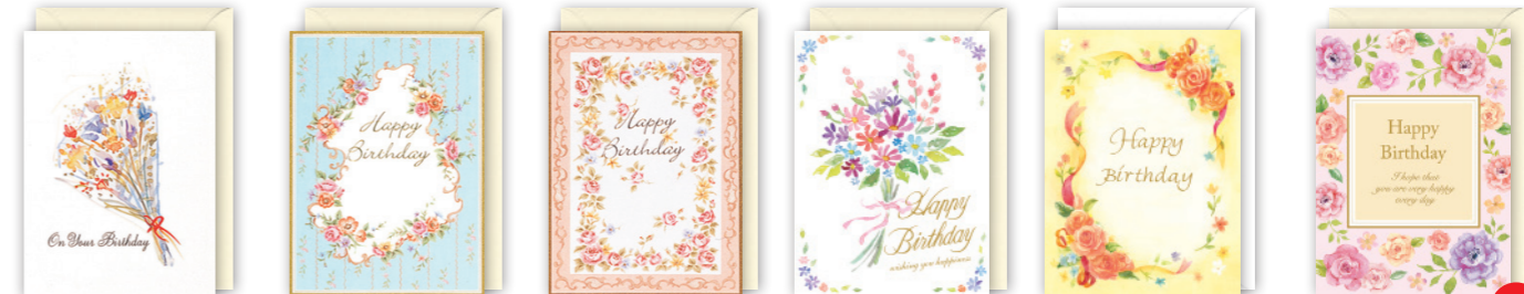
★B200-56 ★B200-63 ★B200-64 ★B220-28 ★B220-29 ★B220-124 New