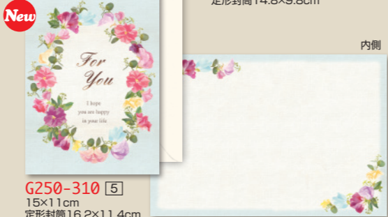
G250-310 [5] 15×11cm 定形封筒16.2×11.4cm