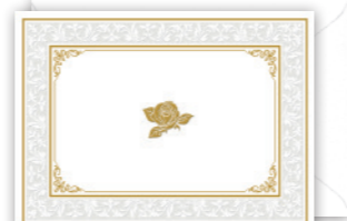
★G320-504 [5] ¥320+税