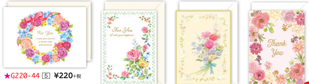
★G220-44 [5] ¥220+税 ★G220-45 [5] ¥220+税 ★G220-58 [5] ¥220+税 ★G220-63 [5] New ¥220+税