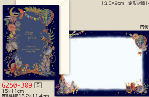
G250-309 [5] 15×11cm 定形封筒16.2×11.4cm