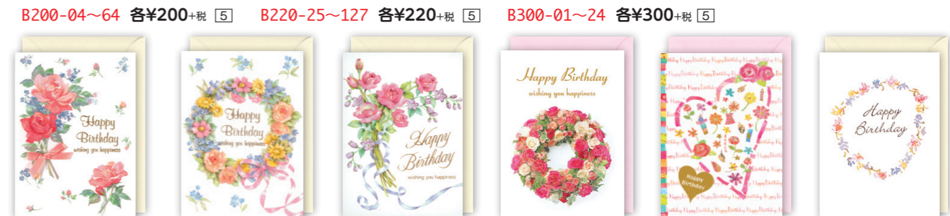
B200-04~64 各¥200+税 [5] B220-25~127 各¥220+税 [5] B300-01~24 各¥300+税 [5]