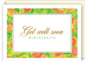
★G200-235 [5] ¥200+税