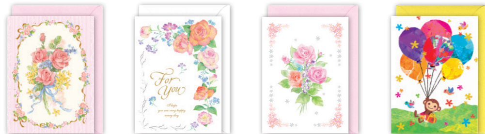
★G300-06 [5] ¥300+税 ★G300-27 [5] ¥300+税 ★G200-31 [5] ¥200+税 ★G200-39 [5] ¥200+税