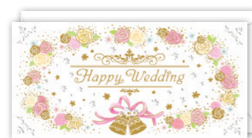
★G300-606 [5] ¥300+税 9×18cm 定形封筒9.8×19cm 聖句 民数6:24